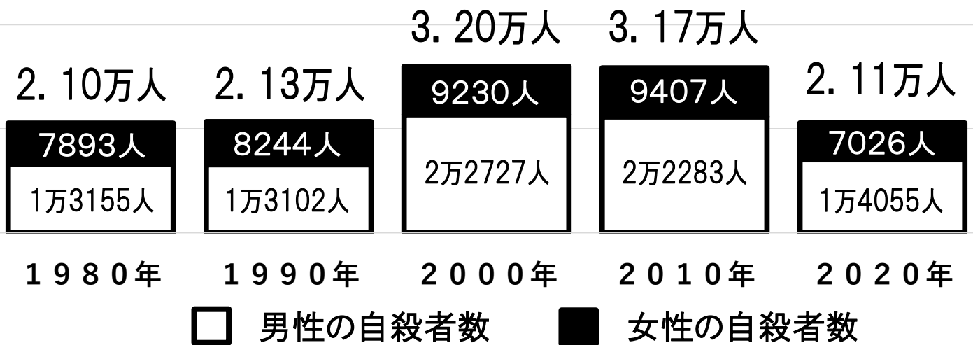
世界各国の人口10万人あたりの自殺者数